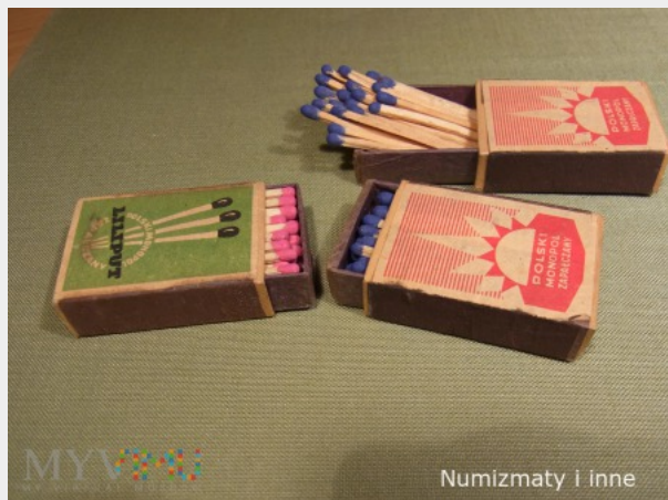
Numizmaty i inne