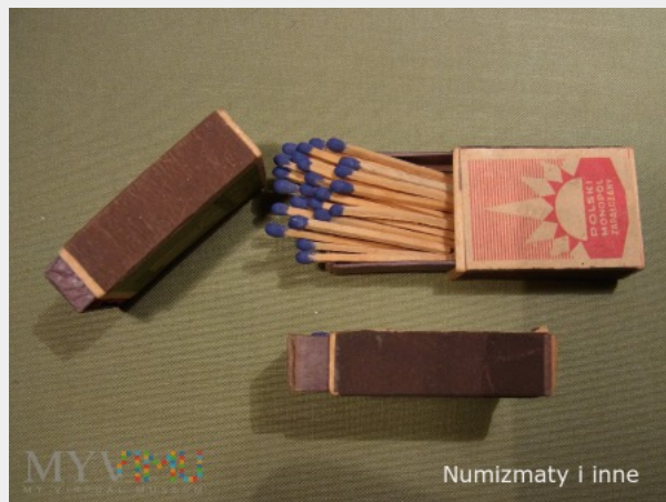
Numizmaty i inne