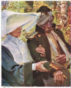
W. Kossak, pinta.